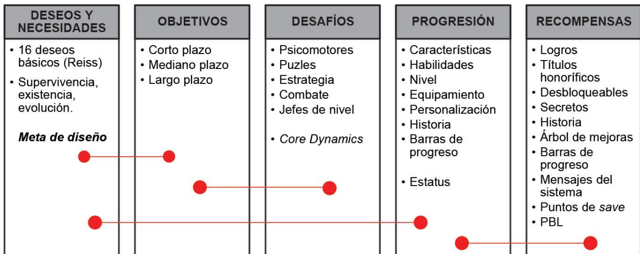
Fig. 1. Componentes de una estructura lúdica según el libro Diseño de juegos en América Latina I: Estructura lúdica (Durgan A. Nallar, 2015).

Cuando un jugador toma contacto con el juego percibe los resultados finales del proceso de diseño, mientras que el diseñador tiende a trabajar a la inversa cuando crea la mecánica del juego. Pareciera un camino correcto; sin embargo, si lo que se desea es que las reglas generen una experiencia determinada en el jugador (y esa será nuestra meta de diseño) es imprescindible diseñar primero la experiencia y después las reglas.